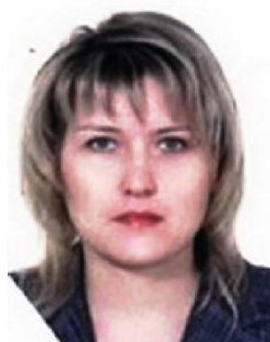
Руководитель гонки (Главный судья)