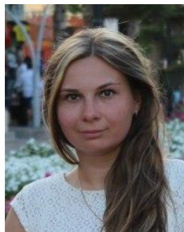
Офицер по связи с участниками