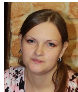
Технический контролер Парка Сервиса