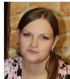
Технический контролер Парка Сервиса